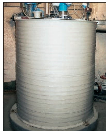
PP-Rührwerksbehälter mit Konusboden zum Anmischen von Salzsäure Durchmesser: 1.500 mm Volumen: 3 m³ Höhe: 1.800 mm

formoplast produziert auch Zwischen- größen und Sonderkonstruktionen.