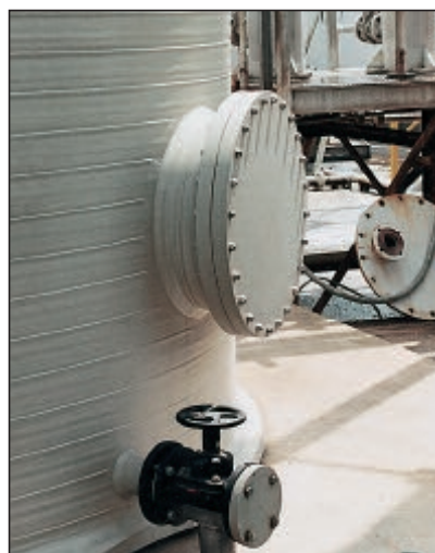
Mannloch DN 600 im Zylinder