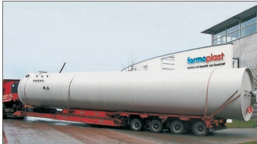
PP-Lagerbehälter mit Flachboden für Biodiesel Lagertemperatur: 50 C Inhalt: 113 m³ Durchmesser: 2.800 mm Höhe: 18.920 mm