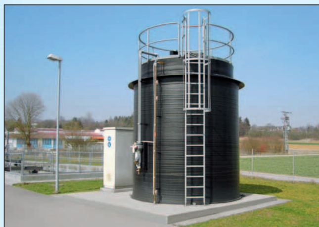
Kläranlage Laichingen, Schwäbische Alb

Zur Energieeinsparung werden die Flachboden-Behälter isoliert.