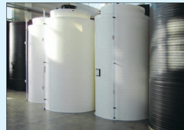
Lagerbehälter aus PE-natur (lebensmittelecht)