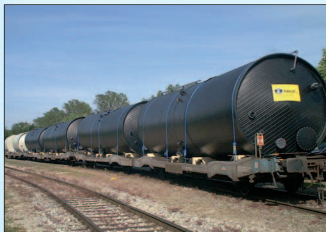
Großbehälter-Transport auf der Schiene

Mit einem Produkt aus dem Hause formoplast haben Sie die Gewähr, die gesetzlichen Bestimmungen zu erfüllen.