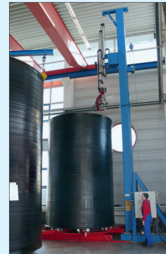
Extrusionsschweißautomat zum Verbinden des Zylinders mit dem Behälterboden