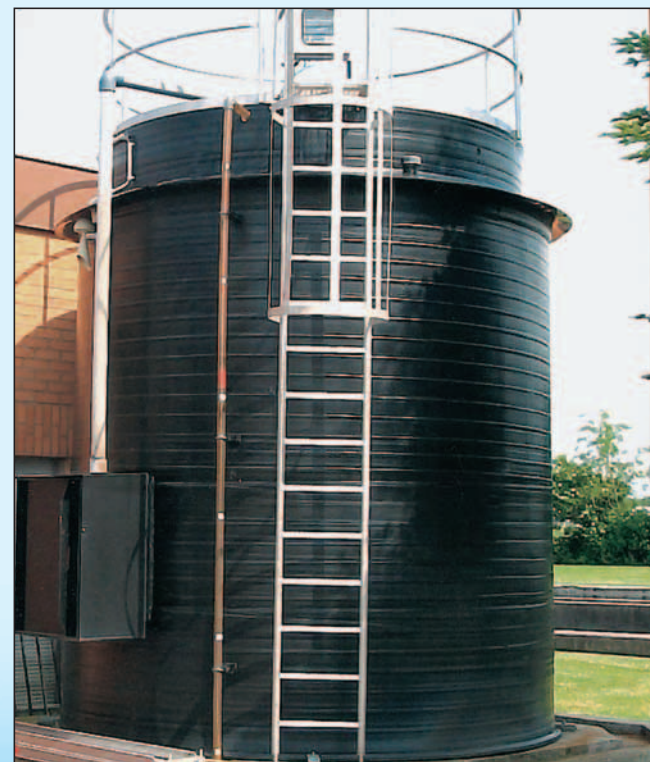
formoplast Lagerbehälter mit Auffangvorrichtungen aus PE-HD für Fällungsmittel auf Kläranlagen Nutzinhalt: 25.000 Liter, Durchmesser: 3.000 mm, Bauhöhe: 4.700 mm