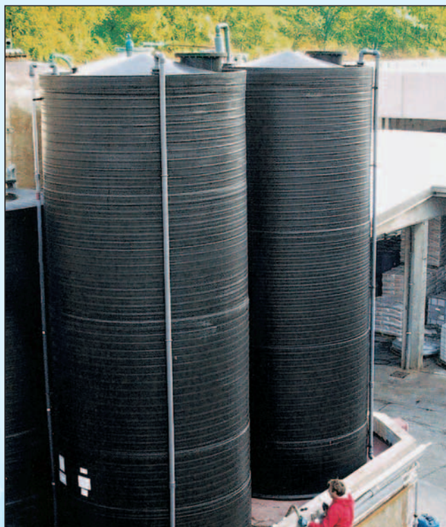
formoplast Lagerbehälter aus PE-HD, in bauseitiger Auffangwanne, Inhalt: 75%-ige Phosphorsäure, Nutzinhalt: 50.000 l, Durchmesser: 3.000 mm, Höhe: 7.500 mm