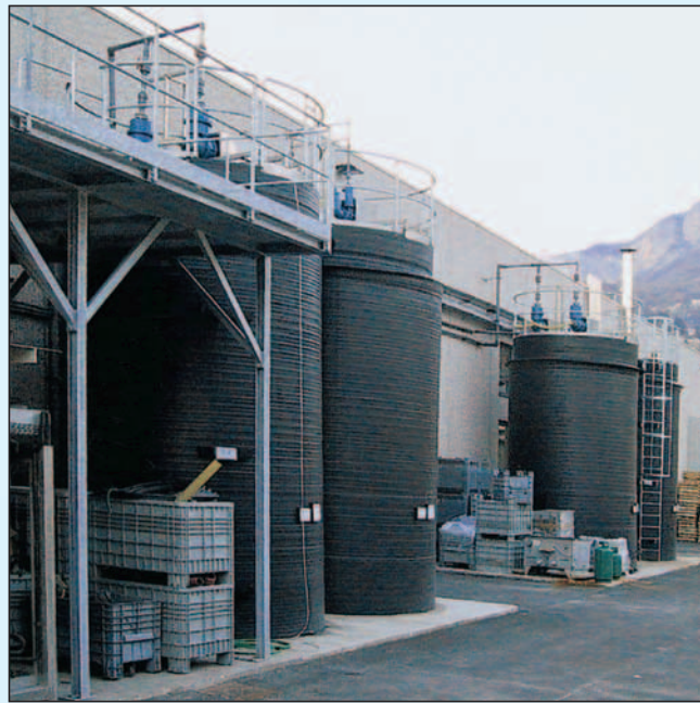
formoplast Lagerbehälter mit Auffangvorrichtungen aus PE-HD Inhalt: 50%-ige Natronlauge, 50%-ige Salpetersäure und 96%-ige Schwefelsäure Nutzinhalt: 30.000 Liter, Durchmesser: 2.800 mm, Bauhöhe: 5.280 mm

Das L agern, A bfüllen und U mschlagen von wassergefährdenden Flüssigkeiten unterliegt strengen gesetzlichen Vorschriften. Das gleiche gilt für Anlagen, die dem H erstellen, B ehandeln und V erwenden dienen.