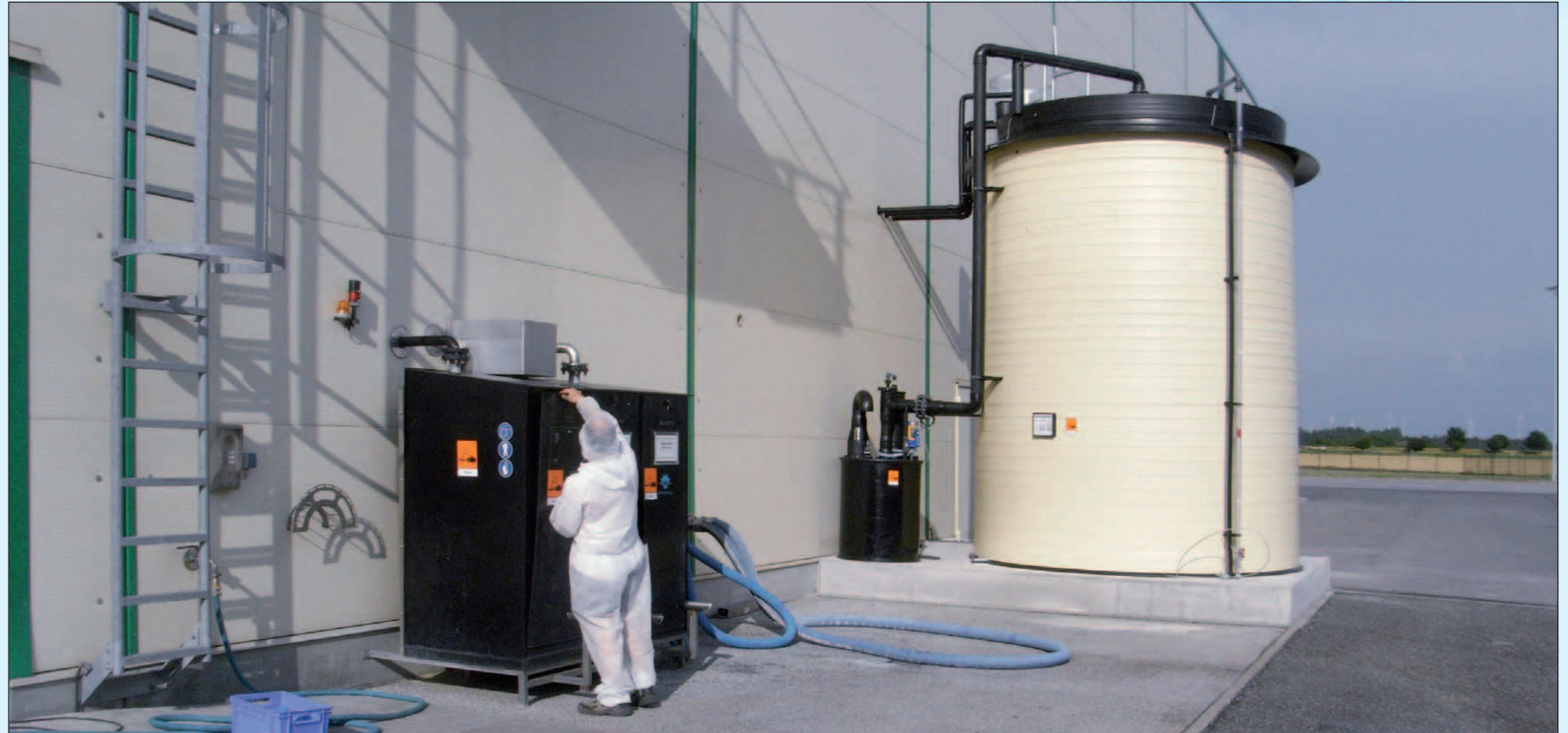
Abfüll- und Lageranlage für Salzsäure mit Abluftwäscher