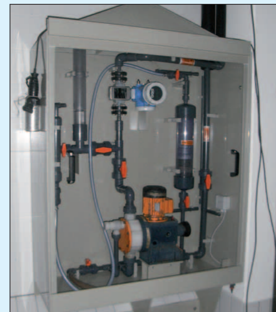
Dosierkabinett 10 bis 100 l/h