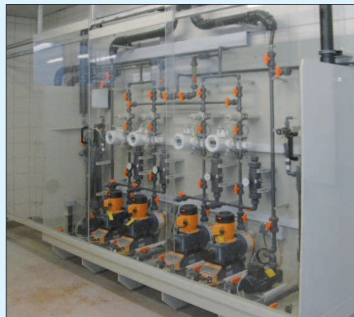
Dosieranlage mit vier Strängen

Die formoplast Behälter sind vielseitig einsetzbar und bewähren sich auch als Abwasserbehälter – mit Tankgrößen von mehr als 200.000 Litern! Als besonderes Extra liefern wir unsere Behälter in jeder gewünschten Farbe.