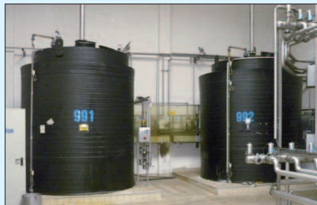
CIP-Anlage in der Molkerei (NaOH + HNO 3 )