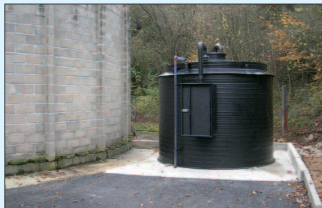
Lager- und Dosieranlage Fällmittel