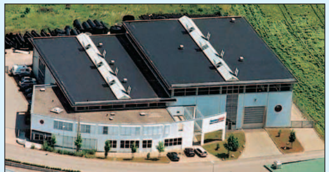
Verwaltungs- und Produktionsgebäude