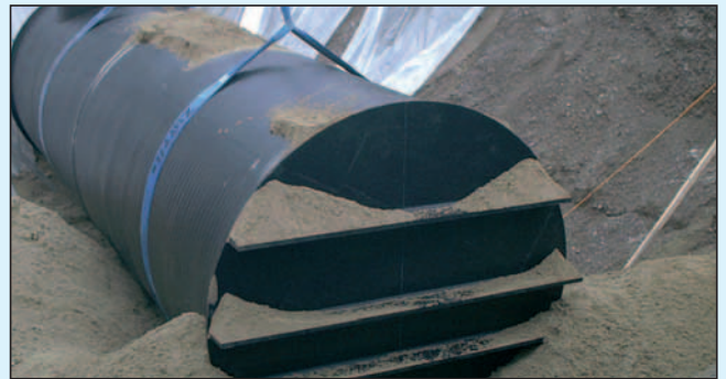
Verdichtete Sand-Einbettung allseitig mindestens 500 mm

Alle Erdbehälter sind auch einwandig lieferbar.