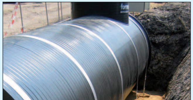
Auftriebssicherung durch verankerte Edelstahlbänder